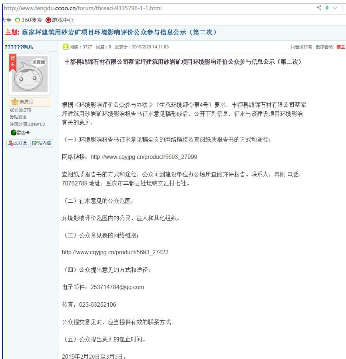
图 4.1 第二次环境影响评价信息公示 (网络平台公示)