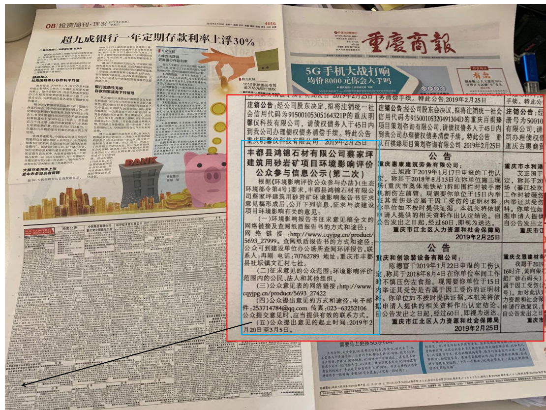
图 4.3 重庆商报 2 月 25 日 (第二次) 公示信息公示