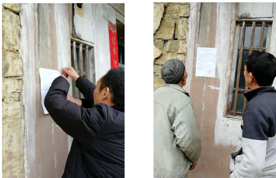
图 4.4 现场张贴公示