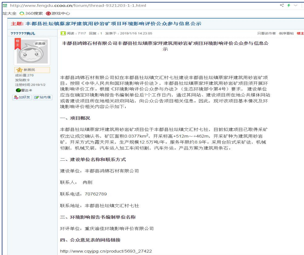
图 3.1 第一次环境影响评价信息公示(网络平台公示)

我单位于2019年1月16日在当地公开网站 http://www.fengdu.ccoo.cn/forum/thread-9321203-1-1.html 进行了第一次信息公示,见图3.1。